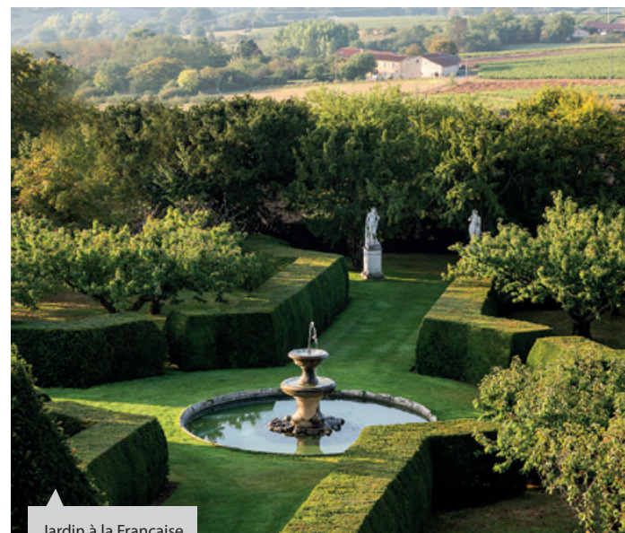
Jardin à la Française