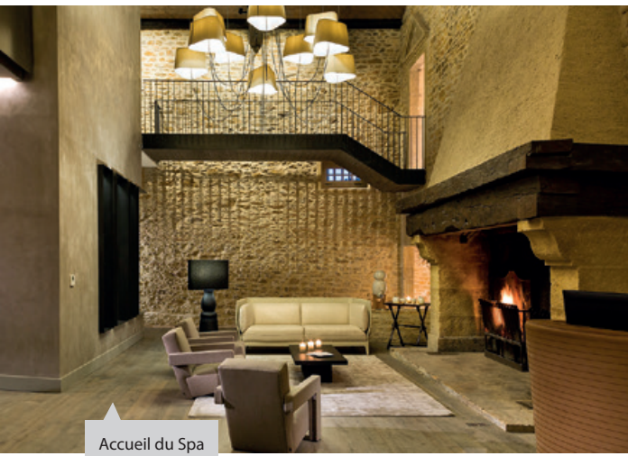
Accueil du Spa